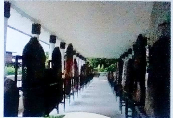
โบเสมาหินทราย

พระใหญ่ เป็นพระพุทธรูปที่สลักจากหินทราย ประทับยืน จำนวน ๑ องค์ ปัจจุบันตั้งอยู่ภายในวิหารเล็ก ๆ ของวัดบ้านคอนสวรรค์ จากลักษณะของพระพุทธรูปยืนขนาดใหญ่ทำด้วยหินทรายสีแดง พระเศียรมีลักษณะทรงกรวย พระพักตร์รูปไข่ยาวมีรอบพระพักตร์ พระขนงตอกันเป็นรูปปีกกา พระเนตรหลุบต่ำ พระนาสิกโด่ง พระโอษฐ์หนา พระกรรณยาว พระหัตถ์ขวาแสดงปาง แสดงธรรม พระหัตถ์ซ้ายแนบพระองค์ ครองสังฆาฏิห่มคลุมอันเป็นลักษณะศิลปะสมัยทวารวดี ราวพุทธศตวรรษที่ 12-16