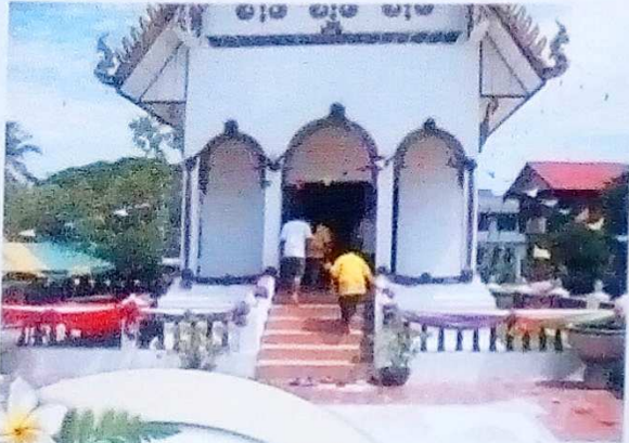
พระใหญ่-โบเสมา